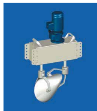
OLOÏDE type 400A: 250 Watt jusqu'à 10'000m 3 .