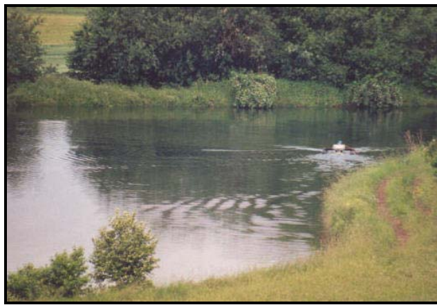
L'étang en été 2002