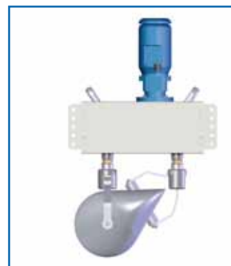
OLOID Typ 400: 250 Watt bis 10'000 m 3 .