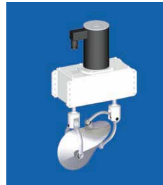
OLOID Typ 200: 50 Watt bis 1'000 m 3 .